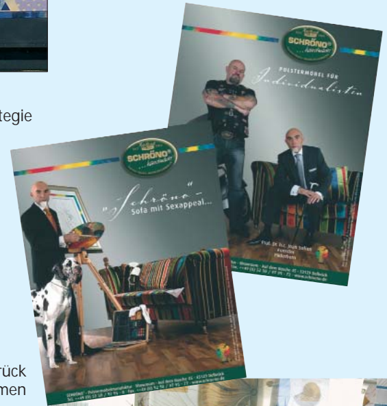
schröno® - Polstermöbelmanufaktur · Delbrück Marketingkampagne / POS-Werbemaßnahmen