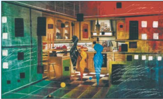
Nobilis Küchen · Verl-Sürenheide Messekampagne