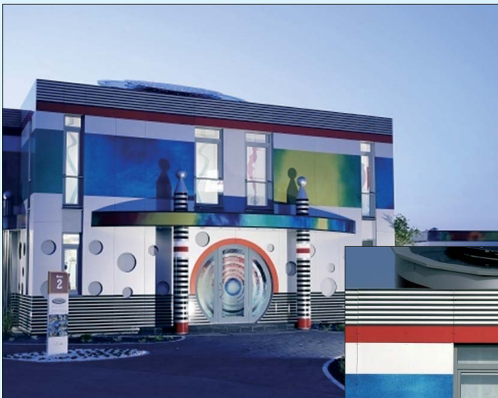
Streif GmbH · Weinsheim Entwurf Fertighaus/Sofron-Haus