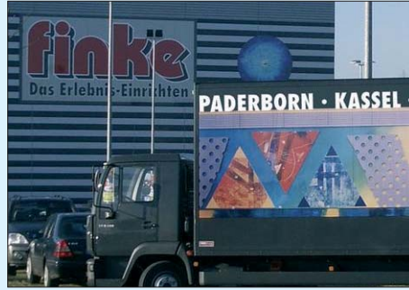
Einrichtungshaus Finke · Paderborn Entwicklung Marketing / Gesamtstrategie